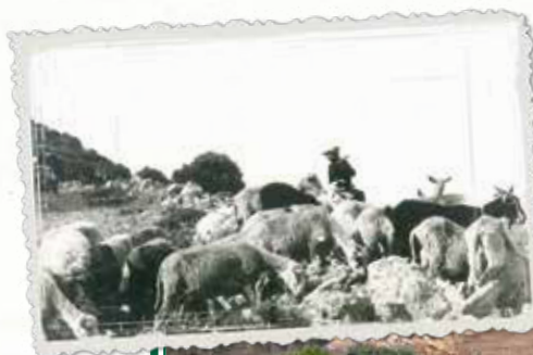
Η παραδοσιακή βοσκή αμνοερφιίων στη Νάξο.

Σε εξέλιξη βρίσκεται η διαδικασία αναγνώρισης νέων προϊόντων ως Προστατευόμενης Ονομασίας Προέλευσης (Π.Ο.Π.), με έμφαση στο αρνί και το κατσίκι Νάξου, Μικρών Κυκλάδων και Αμοργού. Η κατοχύρωση αυτή αναμένεται να αυξήσει την αναγνωρισιμότητα και την αγοραστική αξία των προϊόντων αυτών.