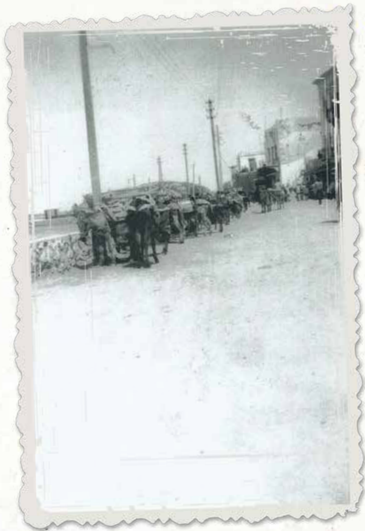
Γεωργοί με τα αγώγια τους, απέναντι από τις αποθήκες της παραλίας, για να προμηθευτούν γεωργικά εφόδια.

Κείμενα, τεκμήρια: Βασίλης Φραγκουλόπουλος