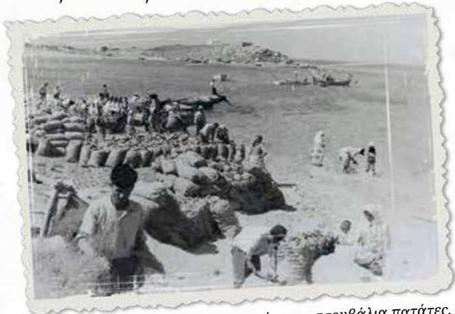
Συσκευασμένες σε τσουβάλια πατάτες, έτοιμες για εξαγωγή.

Προγραμματίζεται η εγκατάσταση γραμμών συσκευασίας πατάτας και νωπού κρέατος σε μικρές μονάδες κατανάλωσης (σκαφάκια), με στόχο τη διείσδυση της Ε.Α.Σ. σε δίκτυα λιανικής εντός και εκτός Ελλάδος.