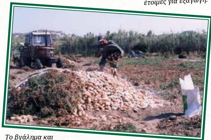
Το βγάλλημα και η συγκέντρωση της πατάτας στα Λιβάδια.